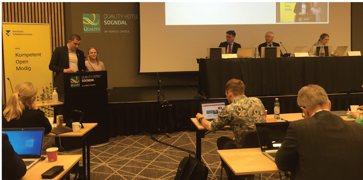
FFU med innlegg på fylkestinget våren 2022, Sogndal hotell

Elev- og lærlingombodet set stor pris på invitasjonar frå FFU, og deltek på møte og samlingar når det let seg gjere.