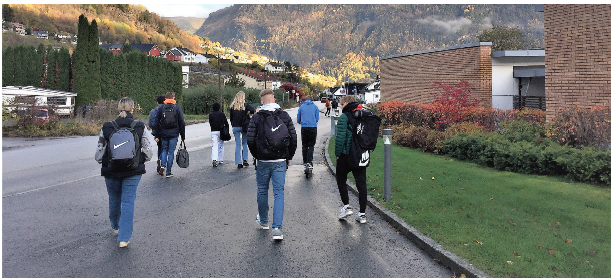
Frå Sogndal vidaregåande skule.

Frå og med august 2022 blir vi to elev- og lærlingombod i Vestland.