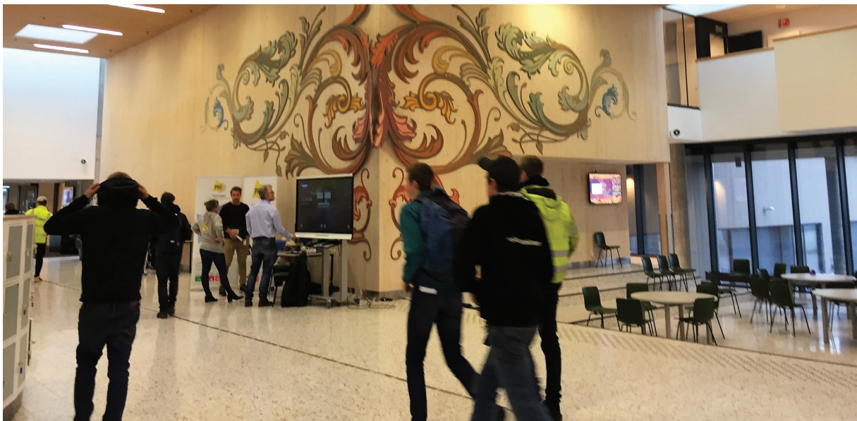
Skulebesøk Voss vidaregåande skule.

Ombodsordninga er meint å vere eit lågterskseltilbod, der ein kjem tidleg på bana før problemet er blitt for stort. Elev- og lærlingombodet jobbar på eit fritt og sjølvstendig grunnlag og er av den grunn ikkje part i saka. Nettopp det er viktig for ikkje å bli oppfatta som «bukke og havresekk.» I møte med ungdommane fokuserer ombodet på korleis elevane og lærlingane sjølve kan vere med å påverke kvaliteten på si eiga opplæring, og korleis ein går fram for å ta opp ei sak med næraste overordna.