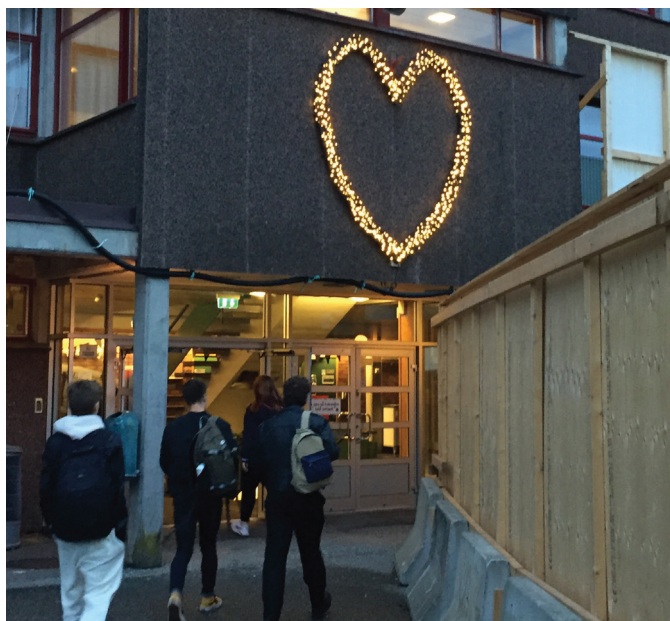
Askøy vidaregåande skule

Mandatet til elev- og lærlingombodet i Vestland